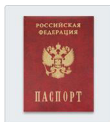
Страница паспорта с данными о регистрации родителя или свидетельство о временной регистрации