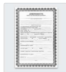
Если вы не родитель — доверенность или другой документ, подтверждающий право предоставлять интересы ребенка