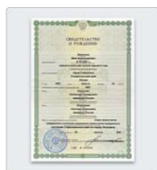
Свидетельство о рождении ребенка